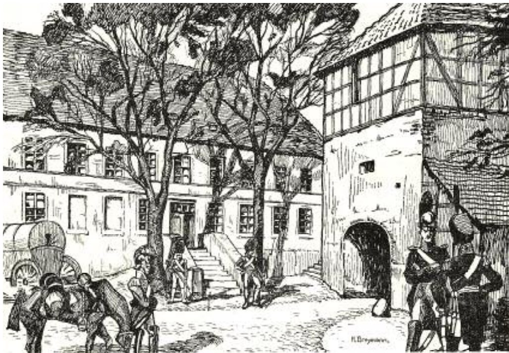
Französische Truppen im Schlosshof zu Düben. Federzeichnung von H. Weismann.

Vom 26. Juli bis 15. August, also 21 Tage, standen hier 8 Offiziere und 117 Mann zur Einquartierung, und kam das Dorf wegen der vielen Fuhren, Boten und so weiter auf 1811 Tlr. 16 Gr. (Nota. Da diese Truppen aber den 13. August ausrückten und auf zwei Tage Brot und Fleisch noch erhalten sollten, welches aber die meisten zu geben nicht imstande waren (besonders Fleisch), so wurde der Schulmeister Herber arretiert, weil der Richter in Düben war, und der Schulmeister hatte sich die Quittung geben lassen. Aber durch einen Ochsen, welchen die Gemeinde wegen des Fleisches geben mußte, wieder los kam.)