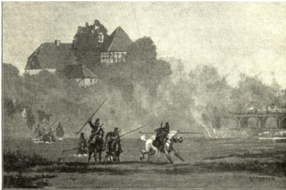
Kosakentrupps der Blücherschen Armee durchschwimmen neben der von den Franzosen in Brand gesteckten Brücke die Mulde bei Düben. Nach dem Gemälde von W. Geyer in der Stadtschule zu Düben.

Schalwände, Zäune, Bretter, Holz, Stangen und dergleichen, teils zur Fourage, teils zum Lager oder Hütten hinausgetragen, Lebensmittel und Vieh wurden genommen wo welches gefunden ward, alles zu beschreiben ist man nicht imstande. Es war sehr viel Kavallerie, Infanterie und eine sehr große Wagenburg. Wie viel Tausend es waren konnte niemand bestimmen: doch habe ich nachher erfahren, es sollten 35 Tausend Mann mit ungefähr 20 Tausend Pferde gewesen sein. Da nun eine große Menge Volks hier war, entstand den 2. Tag schon Mangel an Fourage, und mußten dann nach Durchwehna und Cossa * fouragieren reiten. – Auch entstand bald großer Mangel