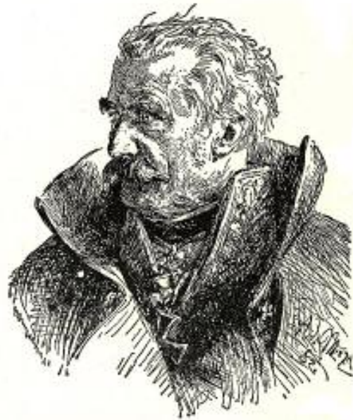
Der Befreier: Fürst Leberecht v. Blücher, preuß. Feldmarschall, Führer der Schlesiſchen Armee.

Den 24. dieses Monats, nachmittags, kamen von Reuden 16 Wagen sächsische Wagenburg ( unterm