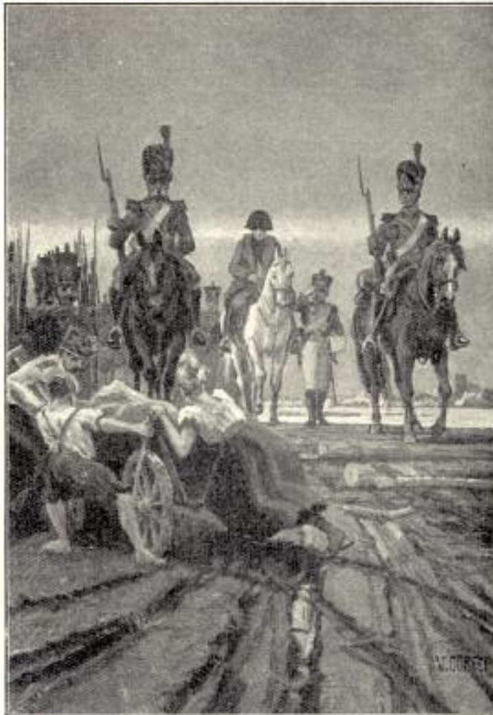
Napoleon besichtigt ein Lager seiner Truppen bei Wellaune, einige Tage vor dem Aufbruch zur Völkerschlacht.